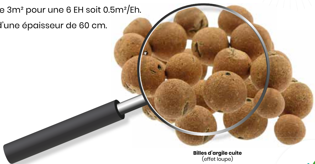
Billes d'argile cuites (effet loupe)